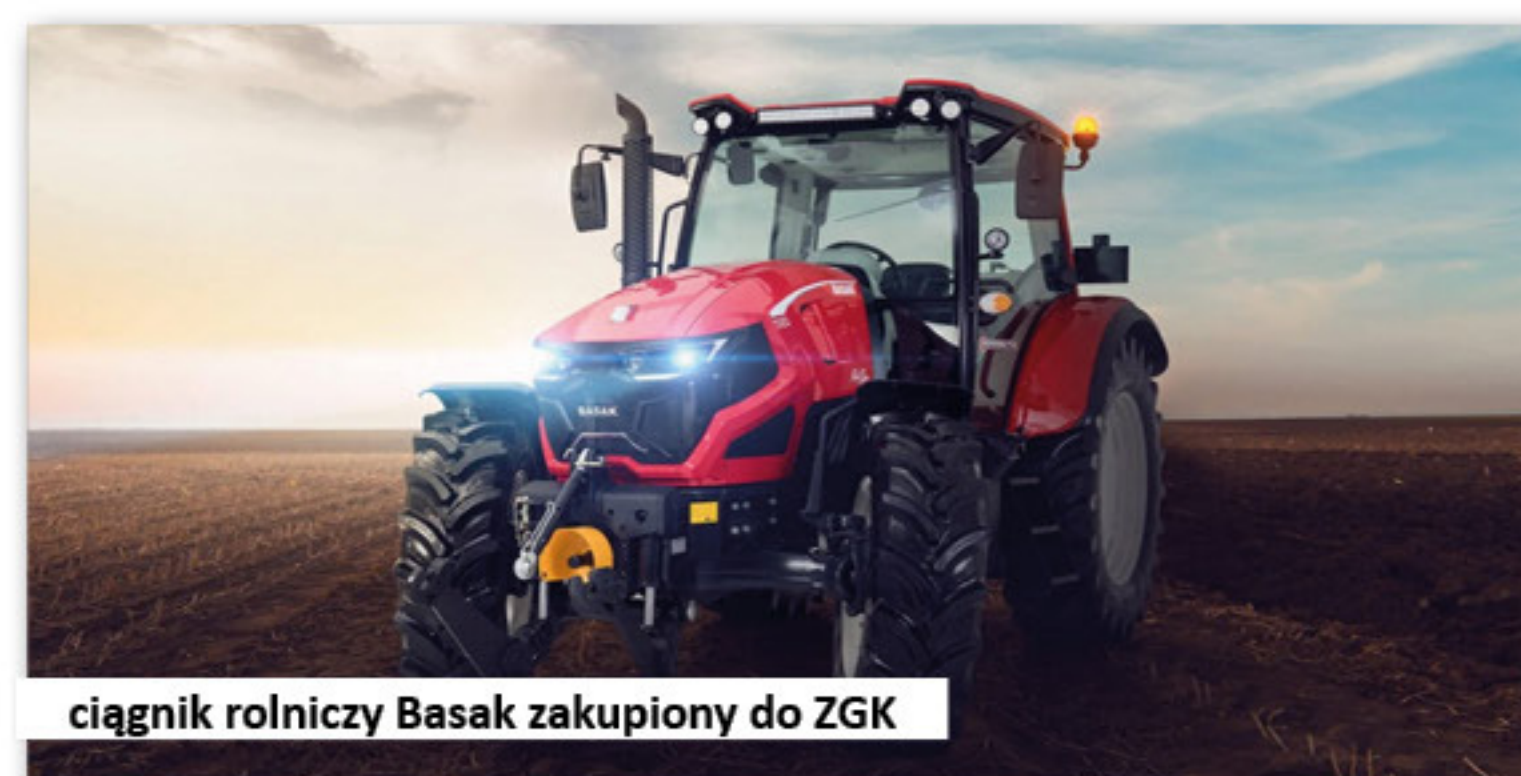
ciągnik rolniczy Basak zakupiony do ZGK

31. Na potrzeby Zakładu Gospodarki Komunalnej