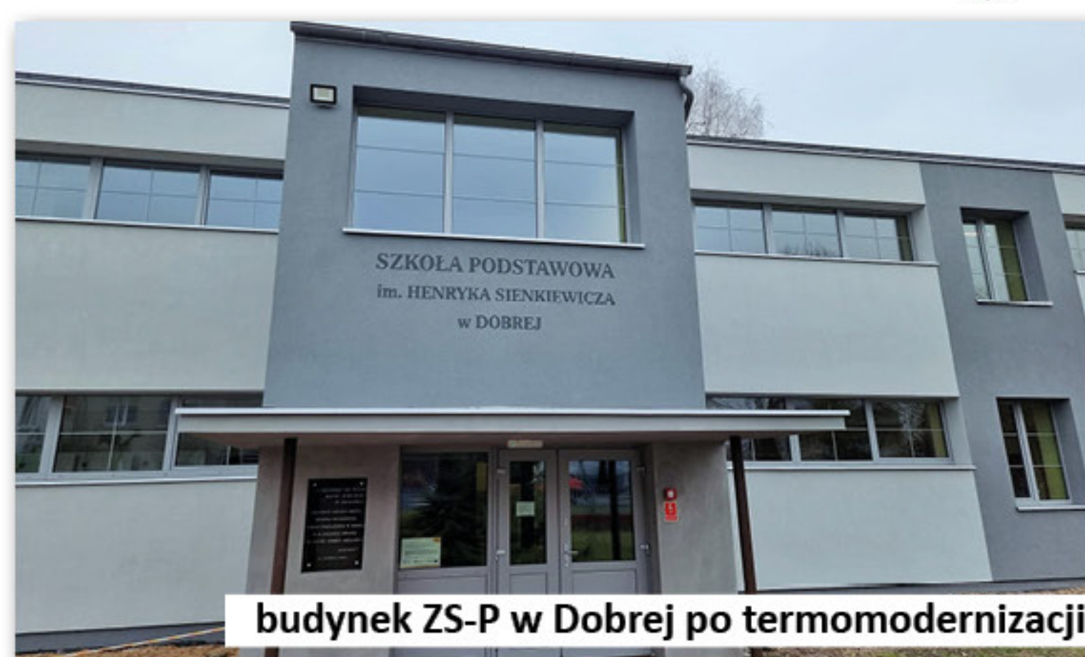
budynek ZS-P w Dobrej po termomodernizacji

5. Zakończyliśmy w 2022 roku zadanie polegające na poprawie efektywności energetycznej budynku Zespołu Szkolno-Przedszkolnego w Dobrej. Wyżej wymienione zadanie polegało na wymianie wszystkich okien i drzwi zewnętrznych