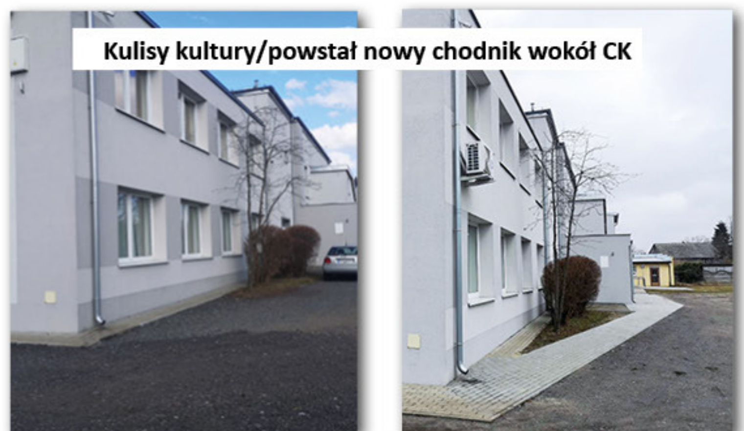
Kulisy kultury/powstał nowy chodnik wokół CK

dokończono 104.686,00 zł. Dzięki zabezpieczonym środkom finansowym w łącznej kwocie 176.486,00 zł wykonano zagospodarowanie terenu poprzez wykonanie chodnika od strony ulicy Dekerta oraz zaplecza budynku, wykonano remont klatki schodowej oraz montaż urządzeń klimatyzacji w 2 salach a także zakupiono wyposażenie sceniczne i stoły do pracowni plastycznej.