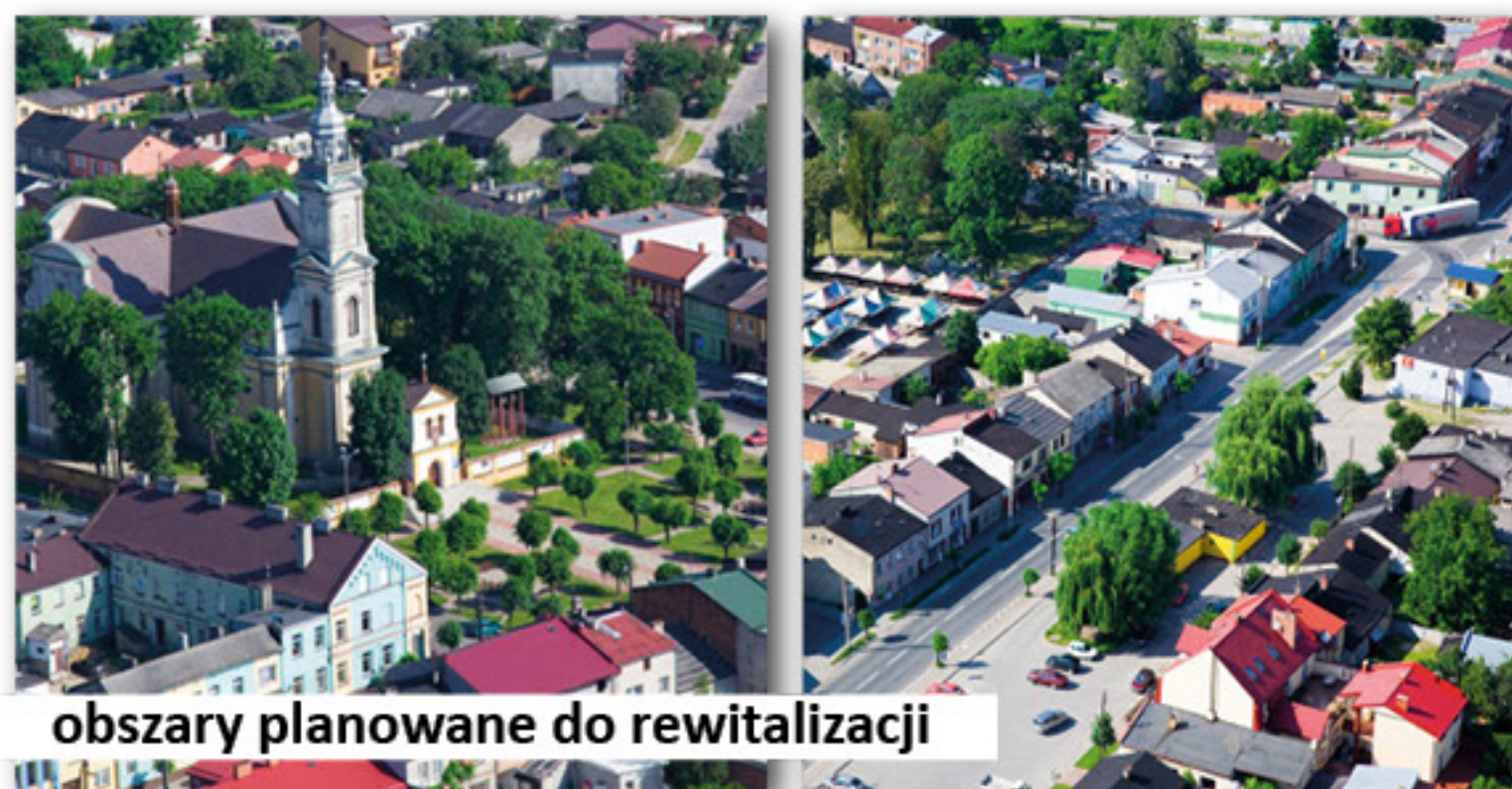
obszary planowane do rewitalizacji

9. Przystąpiliśmy do realizacji pomysłu związanego z rewitalizacją Pl. Mały Rynek i Pl. Wojska Polskiego wraz z modernizacją elewacji budynku Urzędu Miejskiego w Dobrej. W tym celu zostały wykonane projekty koncepcyjne uzgodnione z kierownikiem Wojewódzkiego Urzędu Ochrony Zabytków w Poznaniu Delegatura w Koninie. Jest to pierwszy podstawowy etap mający za zadanie przeprowadzenie rewitalizacji przestrzeni miejskich. Na wykonanie projektów koncepcyjnych z budżetu Gminy Dobra przeznaczyliśmy ok. 80.000,00 zł. W roku obecnym zamierzamy przygotować