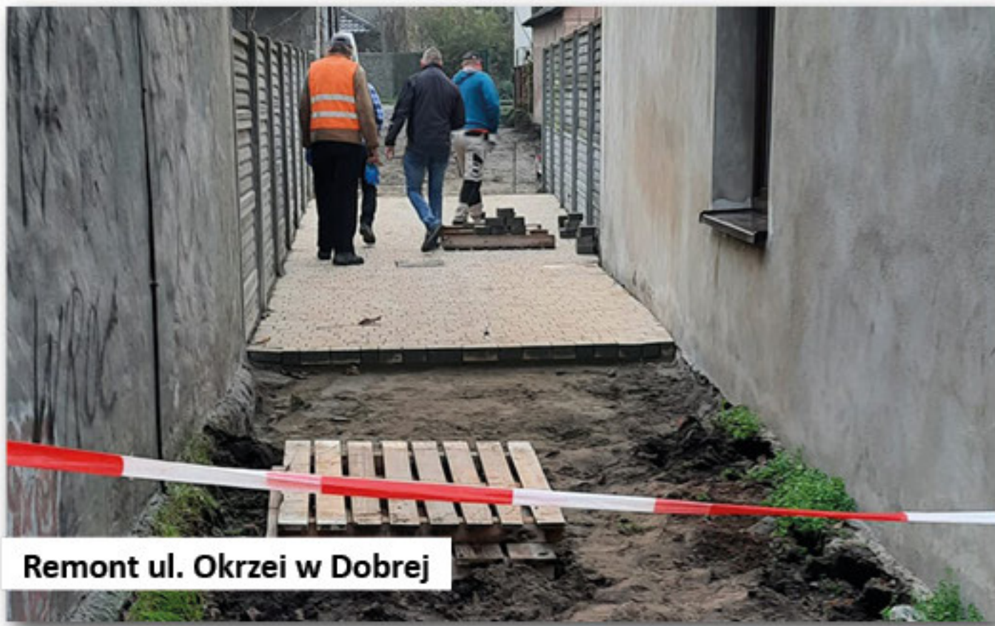
Remont ul. Okrzei w Dobrej