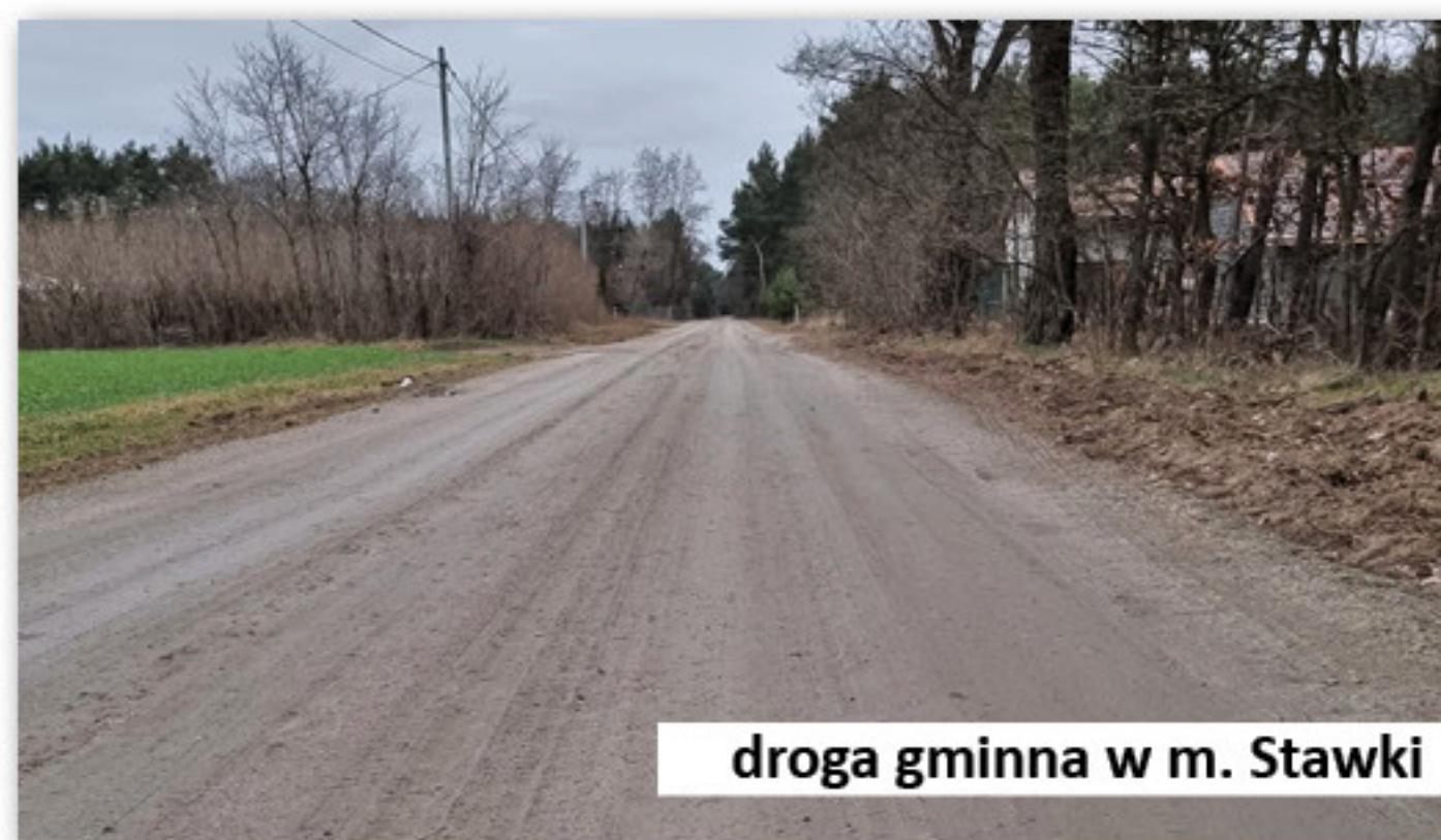
droga gminna w m. Stawki