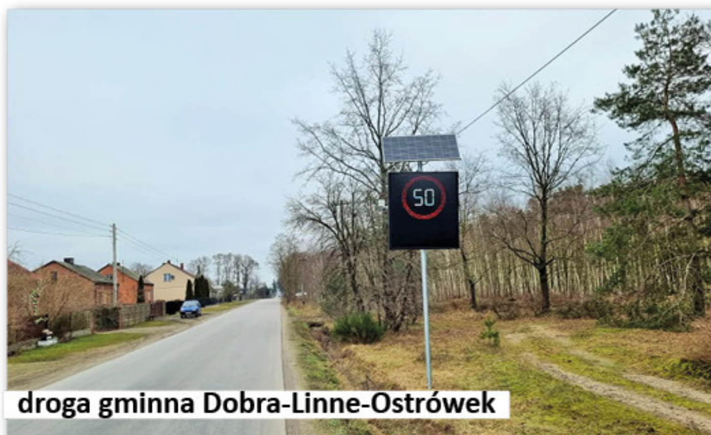
droga gminna Dobra-Linne-Ostrówek

416.391,00 zł (50% całości kosztów), i z budżetu gminy: 416.392,07 zł. II etap został wykonany w latach 2021 i 2022 za kwotę 1.969.853,75 zł. Na to zadanie pozyskaliśmy dofinansowanie w kwocie 1.575.883,00 zł, to jest 80% całości kosztów związanych z remontem, a z budżetu gminy przeznaczaliśmy 393.970,75 zł (20%). W ramach obu etapów prac wykonano jezdnię asfaltową o szerokości 5 m i łącznej długości ok. 4,3 km, chodnik dla pieszych na długości ponad 700 metrów, pobocza z tłuczniem kamiennego. Odtworzono również rowy przydrożne, a także wykonano 3 przejścia dla pieszych z sygnalizacją ostrzegawczą, bariery ochronne oraz 2 tablice radaru informujące o zmiennej prędkości ruchu pojazdów i punktach karnych. Dofinansowanie jakie otrzymała Gmina pochodziło ze środków Rządowego Funduszu Rozwoju Dróg.