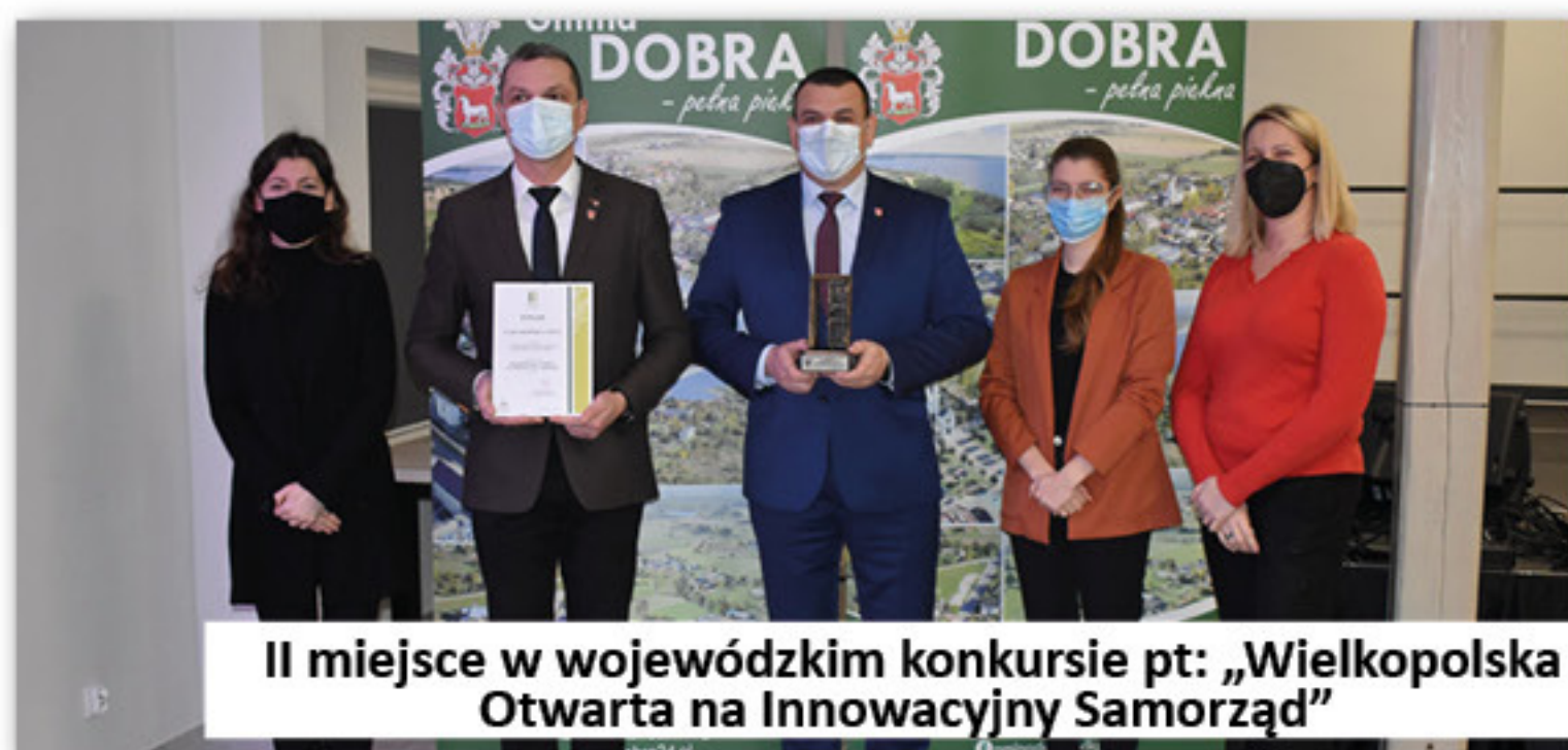
II miejsce w wojewódzkim konkursie pt: „Wielkopolska Otwarta na Innowacyjny Samorząd”

trwania projektu zakwalifikowaliśmy do transportu 205 osób, w tym 85 osób z orzecznym stopniem niepełnosprawności. Ilość zrealizowanych transportów, to 1708. Samochód łącznie przejechał prawie 91 tyś km. Od 2023 roku w/w usługa jest częściowo odpłatna o czym informowaliśmy na naszej stronie internetowej na której między innymi znajduje się obowiązujący cennik.