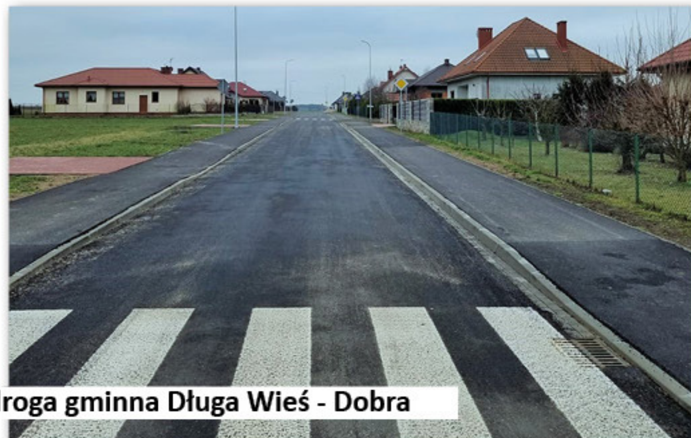
droga gminna Długa Wieś - Dobra

Województwa Wielkopolskiego, 235.714,10 zł to środki Rządowego Funduszu Inwestycji Lokalnych, natomiast 653.253,60 zł pochodziło ze środków własnych budżetu Gminy Dobra.