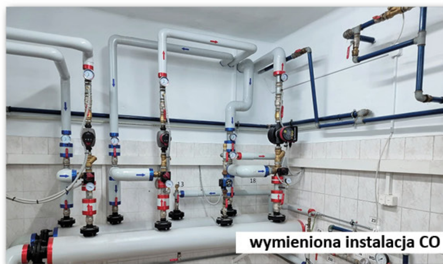
wymieniona instalacja CO

na dwukomorowe (trzyszybowe), wymianie parapetów wewnętrznych i zewnętrznych, ociepleniu ścian budynku styropianem o grubości 22 centymetrów wraz z wykonaniem nowej elewacji, ociepleniu dachu styropianem o grubości 25 centymetrów, wymianie wszystkich rynien, wymianie pieca centralnego ogrzewania na gazowy, wymianie wszystkich rur i grzejników, wymianie instalacji elektrycznej, odgromowej,