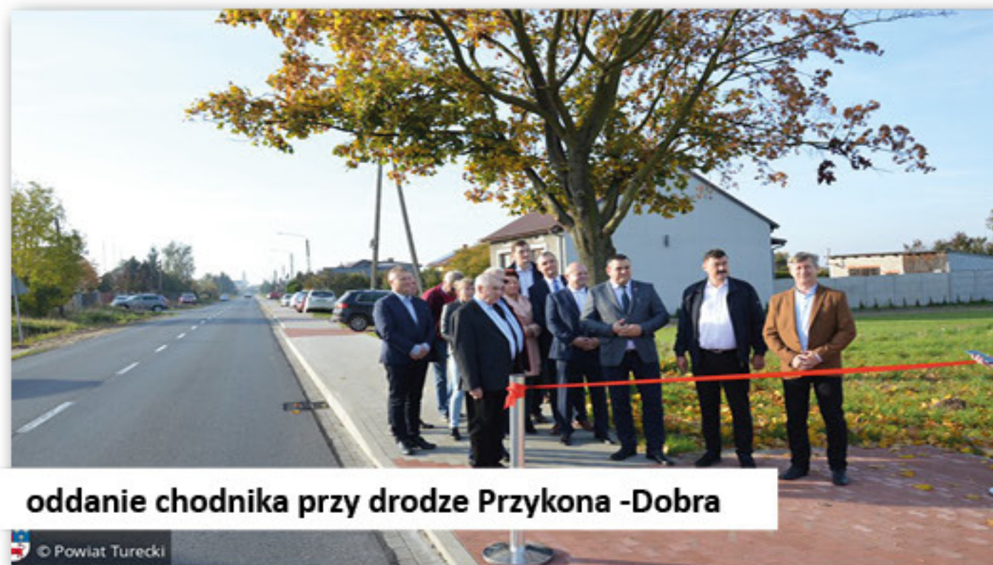
oddanie chodnika przy drodze Przykona -Dobra

Przykona – Dobra w miejscowości Długa Wieś– dotacja dla powiatu w kwocie 49.783,42 zł.