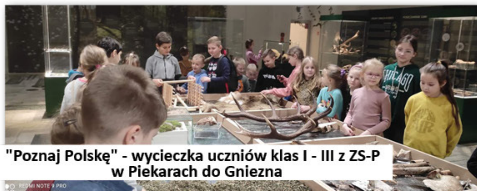
"Poznaj Polskę" - wycieczka uczniów klas I - III z ZS-P w Piekarach do Gniezna

w niepowtarzalnym środowisku edukacyjnym. Wsparcie objęło organizację 1 wycieczki trzydniowej w kl. IV-VIII w Szkole Podstawowej w Dobrej oraz organizację 2 wycieczek trzydniowych w kl. I-III oraz IV-VIII a także 2 wycieczek jednodniowych w kl. I-III oraz IV-VIII Szkoły Podstawowej w Piekarach. Wartość projektu ogółem to kwota 71.294,00 zł, w tym 55.000,00 zł, to środki pochodzące z Ministerstwa Edukacji i Nauki, natomiast 16.294,00 zł, to środki pochodzące od rodziców dzieci, które uczestniczyły w wycieczkach.