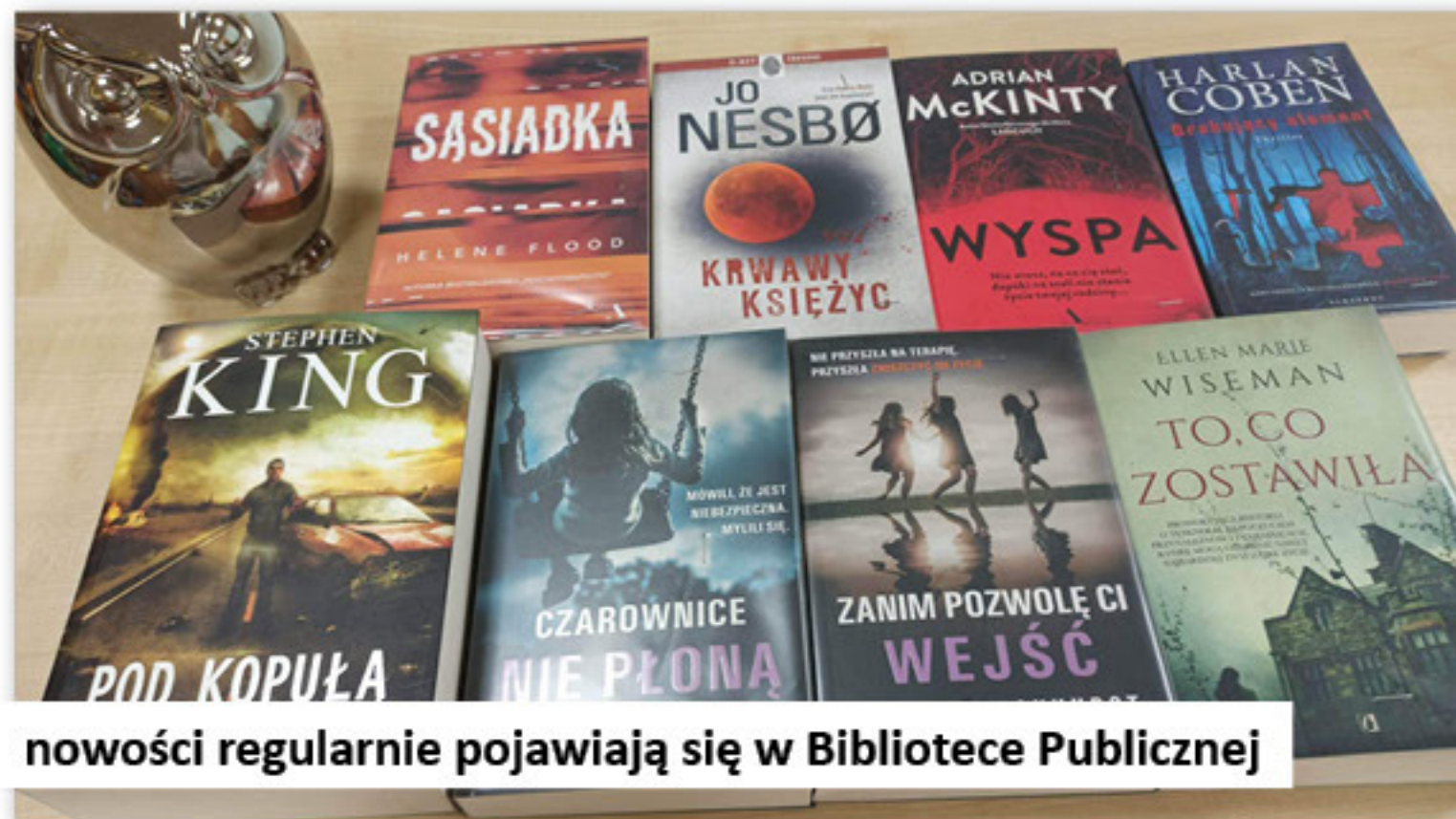
nowości regularnie pojawiają się w Bibliotece Publicznej

17. Uczestniczymy w Programie wieloletnim „Narodowy Program Rozwoju Czytelnictwa 2.0 na lata 2021-2025”. W ramach w/w programu uzyskaliśmy wsparcie dla Biblioteki Publicznej w Dobrej, które udzielone jest w ramach programu wieloletniego na zakup książek będących nowościami wydawniczymi. Wartość projektu ogółem, to kwota 9.264,61 zł, w tym środki własne Gminy Dobra, to 6.033,61 zł, natomiast 3.231,00, to środki pochodzące z budżetu państwa.