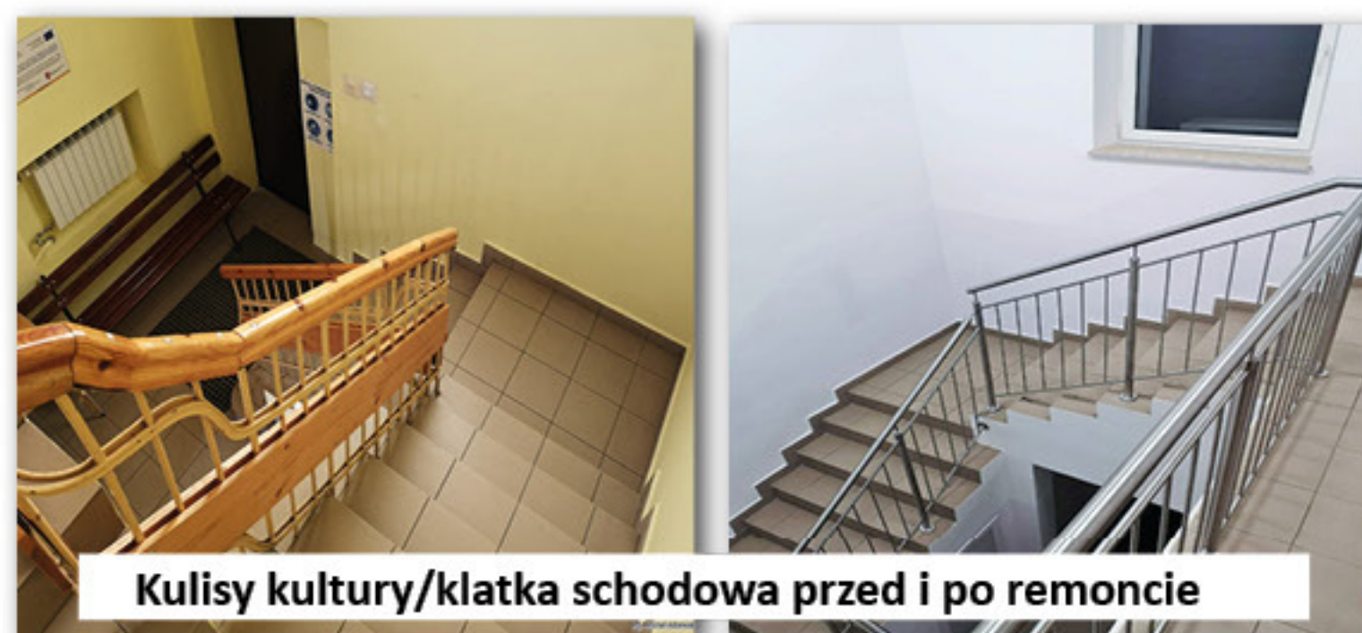
Kulisy kultury/klatka schodowa przed i po remoncie

16. Inwestowaliśmy również środki w Centrum Kultury w Dobrej, dzięki czemu zostało zrealizowane zadanie dotyczące poprawy warunków funkcjonowania Centrum Kultury w Dobrej, poprzez remont klatki schodowej, wykonanie chodnika oraz montaż klimatyzacji. Wniosek o dofinansowanie tego przedsięwzięcia został złożony do Urzędu Marszałkowskiego Województwa Wielkopolskiego w ramach programu Kulisy Kultury. Wniosek został pozytywnie rozpatrzony i przyznano na realizację powyższego zadania kwotę 71.800,00 zł, natomiast z budżetu Gminy Dobra