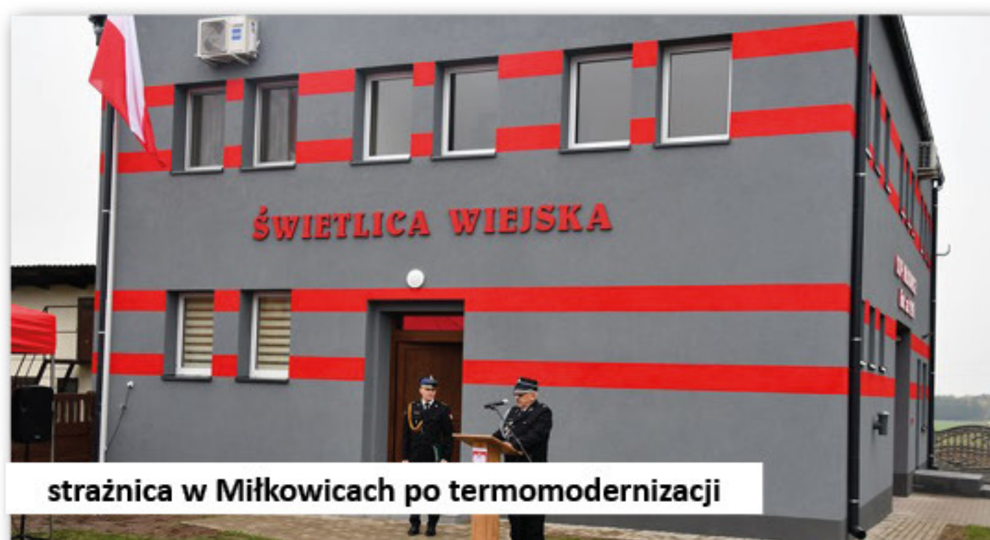
strażnica w Miłkowicach po termomodernizacji

◆ Przedsięwzięcie pn.: „Termomodernizacja - ocieplenie ścian zewnętrznych strażnicy Ochotniczej Straży Pożarnej w Miłkowicach”. Całkowity koszt zadania 78.000,00 zł, dofinansowanie ze środków Wojewódzkiego Funduszu Ochrony Środowiska i Gospodarki Wodnej w Poznaniu: 70.000,00 zł, dofinansowanie z budżetu Gminy Dobra: 8.000,00 zł.