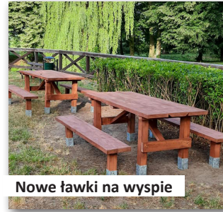
Nowe ławki na wyspie

wanie Zespołu Dworsko – Parkowego w Długiej Wsi poprzez wykonanie elementów małej architektury i rozbudowę oświetlenia parkowego oraz 3.000,00 zł. na integracyjne warsztaty Bożonarodzeniowe.