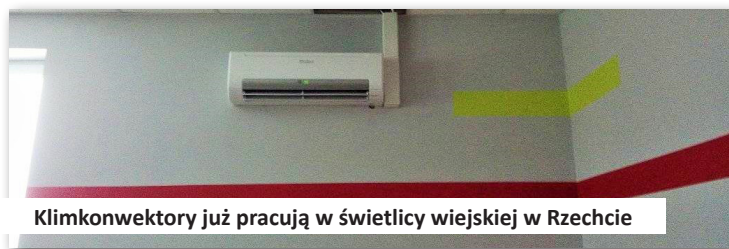
Klimkonwektory już pracują w świetlicy wiejskiej w Rzechcie

Za 18.143,60 zł. został przeprowadzony remont świetlicy wiejskiej w miejscowości Rzechta oraz 3.000,00 zł. przeznaczono na zakup i montaż wyposażenia do świetlicy wiejskiej w Rzechcie (klimakonwektory).