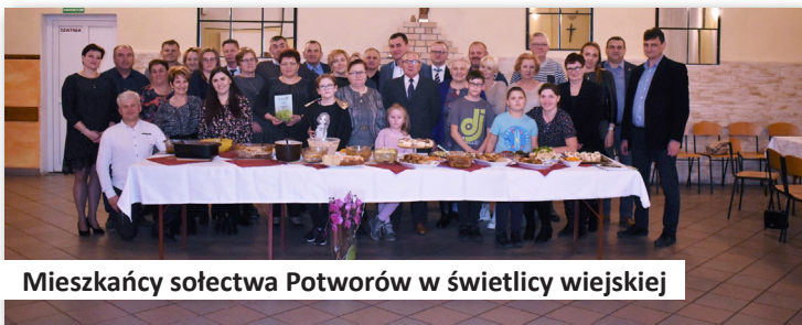
Mieszkańcy sołectwa Potworów w świetlicy wiejskiej

dla sołectwa Potworów na realizację zadania pt.: „Podniesienie standardu świetlicy wiejskiej w Potworowie”. Na zakup stołów i krzeseł przeznaczono kwotę 6.000,00 zł., z czego 3.900,00 zł., to dofinansowanie Samorządu Województwa Wielkopolskiego, natomiast 2.100,00 zł. to wkład własny ze środków Gminy Dobra,