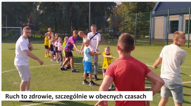
Ruch to zdrowie, szczególnie w obecnych czasach

25. Nieustannie staramy się prowadzić rzetelną i sprawną opiekę społeczną dzięki działalności Miejsko-Gminnego Ośrodka Pomocy Społecznej w Dobrej, poprzez który to Ośro-