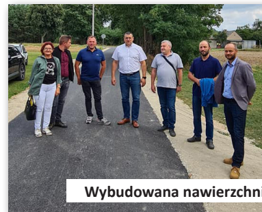
Wybudowana nawierzchnia asfaltowa we wsi Januszkówka

Kwota w całości przeznaczona na przebudowę drogi gminnej we wsi Januszkówka na odcinku ok. 800 metrów.