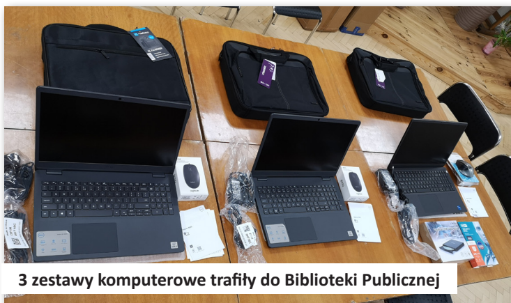
3 zestawy komputerowe trafiły do Biblioteki Publicznej

18. Podpisaliśmy umowę na realizację Programu „Kraszewski. Komputery dla Bibliotek”. Celem programu jest zapewnienie zrównoważonego dostępu do technologii teleinformatycznych poprzez wyposażenie Biblioteki Publicznej w Dobrej