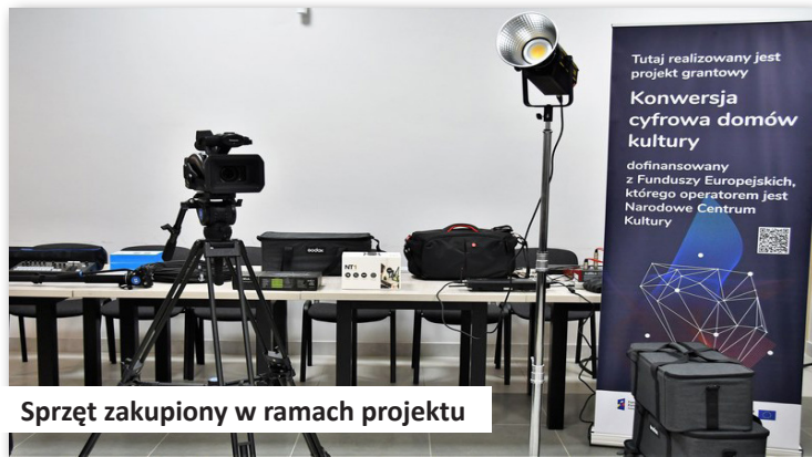
Sprzęt zakupiony w ramach projektu

z czego 167.130,00 zł., to środki unijne (88,18%). Pozostałe środki 22.410,00 zł., to wkład własny Gminy Dobra. W ramach projektu zainstalowano na sali widowiskowej pętlę indukcyjną dla osób korzystających z aparatów słuchowych z wbudowaną cewką indukcyjną. Zakupiono pętlę indukcyjną tzw.