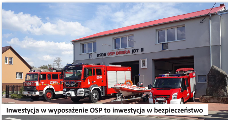
Inwestycja w wyposażenie OSP to inwestycja w bezpieczeństwo

36. Co roku z budżetu Gminy Dobra przeznaczamy kwotę około 240.000,00 zł na bieżące funkcjonowanie i utrzymanie jednostek Ochotniczych Straży Pożarnych w ramach ochrony przeciwpożarowej.