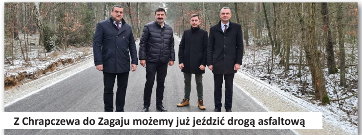
Z Chrapczewa do Zagaju możemy już jeździć drogą asfaltową

10.000,00 zł. wykorzystano na przebudowę drogi gminnej w miejscowości Szymany o długości ok. 900 metrów na części nieruchomości oznaczonej numerem ewidencyjnym 109 obręb Szymany - wykonanie dokumentacji, oraz 3.795,82 zł. przeznaczono na obcięcie zadrzewień i gałęzi przy drogach gminnych na terenie sołectwa.