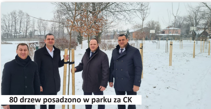
80 drzew posadzono w parku za CK

11. Zakupiliśmy sadzonki drzew miododajnych w ilości 80 szt. przeznaczonych do nasadzeń zastępczych w parku za Centrum Kultury w Dobrej. Koszty zakupu sadzonek to kwota 16.031,52