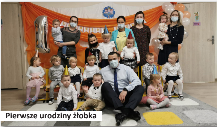
Pierwsze urodziny żłobka

racyjnego na lata 2014-2020 w ramach projektu „Stawiamy na dobry start” dofinansowanego z Europejskiego Funduszu Socjalnego w ramach Wielkopolskiego Regionalnego Programu Operacyjnego na lata 2014-2020 umożliwiliśmy powrót rodzicom, szczególnie mamom do pracy zawodowej dając im nieodpłatną opiekę nad dziećmi do 30 września 2022 roku. Jedyną opłatą jaka pojawiła się w żłobku, to opłata za wyżywienie w kwocie miesięcznej 121 zł. Otrzymane dofinansowanie, to kwota 873.581,81 zł (95%) a całkowita wartość projektu, to 919.559,81 zł. Wkład własny Gminy Dobra, to kwota 45.978,00 zł (5%).