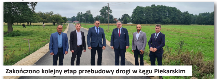
Zakończono kolejny etap przebudowy drogi w Łęgu Piekarskim

Środki te w całości zostały przeznaczone na przebudowę drogi gminnej o nr 646057P i 646058P położonej w Łęgu Piekarskim o długości ok. 630 metrów.