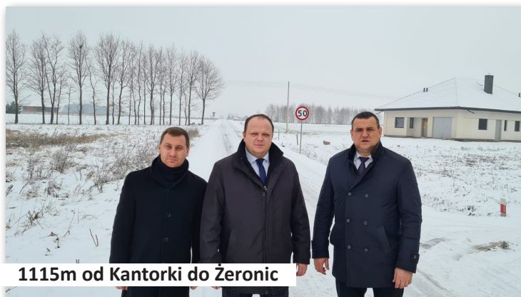
1115m od Kantorki do Żeronic

• dokonaliśmy przebudowy drogi gminnej położonej w miejscowości Żeronice. W ramach zadania wykonaliśmy 1115 metrów drogi o szerokości 4 metrów z masy bitumicznej. Wartość inwestycji ogółem, to kwota 675.022,77 zł., w tym środki własne Gminy Dobra, to 561.522,77 zł., natomiast 113.500,00zł., to środki pochodzące z Urzędu Marszałkowskiego Wojewódz-