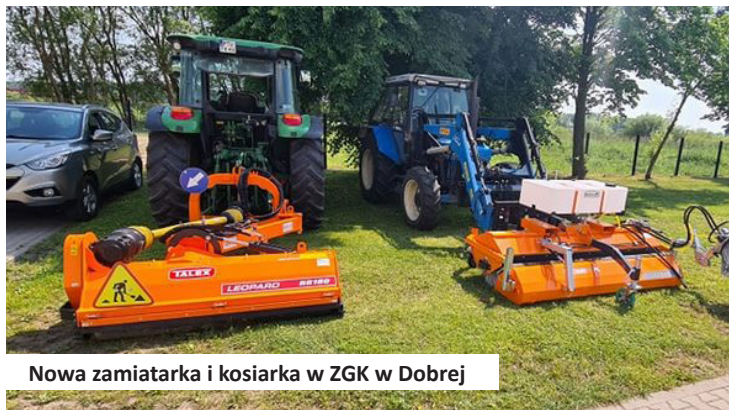
Nowa zamiarkę i kosiarkę w ZGK w Dobrej

32. Na potrzeby Zakładu Gospodarki Komunalnej w roku 2021 zakupiliśmy kosiarkę do koszenia poboczy i rowów oraz zamiarkę do chodników i ulic za łączną kwotę 52.000,00 zł.