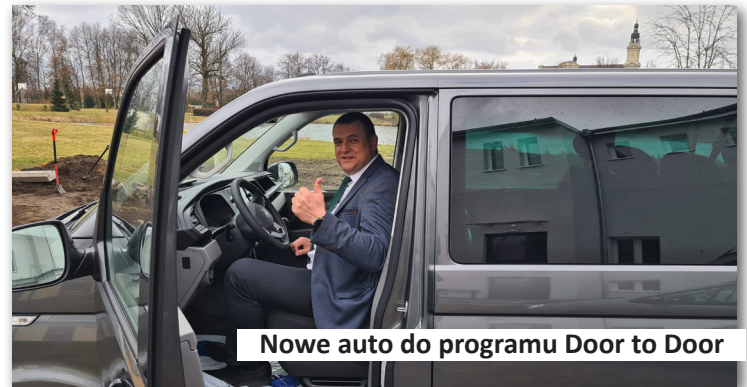
Nowe auto do programu Door to Door

5. W 2021 roku uruchomiliśmy transport Door to Door (od drzwi do drzwi) za środki pozyskane w 100% z Państwowego Funduszu Rehabilitacji Osób Niepełnosprawnych. Dzięki temu dofinansowaniu zakupiliśmy nowy mikrobus do przewozu osób korzystających z usług indywidualnego transportu Door to Door w Gminie Dobra. Koszt zakupu samochodu, to kwota 183.885,00 zł pokryty w 100% z dofinansowania. W ramach projektu zatrudniliśmy koordynatora i kierowcę, których koszty utrzymania również w 100% pokrywane są z dofinansowania. Całkowita wartość projektu grantowego