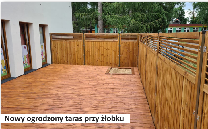
Nowy ogrodzony taras przy żłobku

3. W minionym roku wybudowaliśmy przy Żłobku Samorządowym taras i ogrodzenie tworząc w ten sposób miejsce do zabaw dla dzieci bezpośrednio przy budynku, oraz zamontowaliśmy klimatyzację w budynku żłobka łącznie za kwotę około 35.000,00 zł.