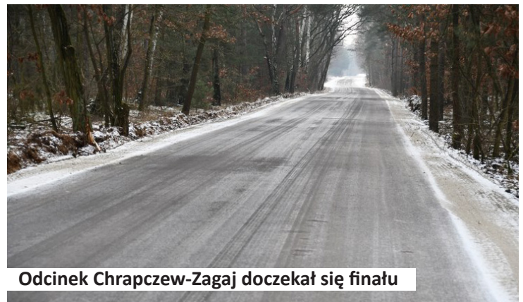
Odcinek Chrapczew-Zagaj doczekał się finału

stwa Wielkopolskiego w ramach dofinansowania budowy (przebudowy) dróg dojazdowych do gruntów rolnych.